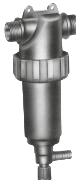
TMMPP 1 1/4" - 1 1/2"