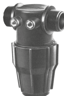
TMMPP 1/2" - 3/4" - 1"