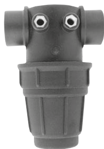
TFFPP 1/2" - 3/4" - 1"